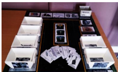
Jeu de la déchetterie